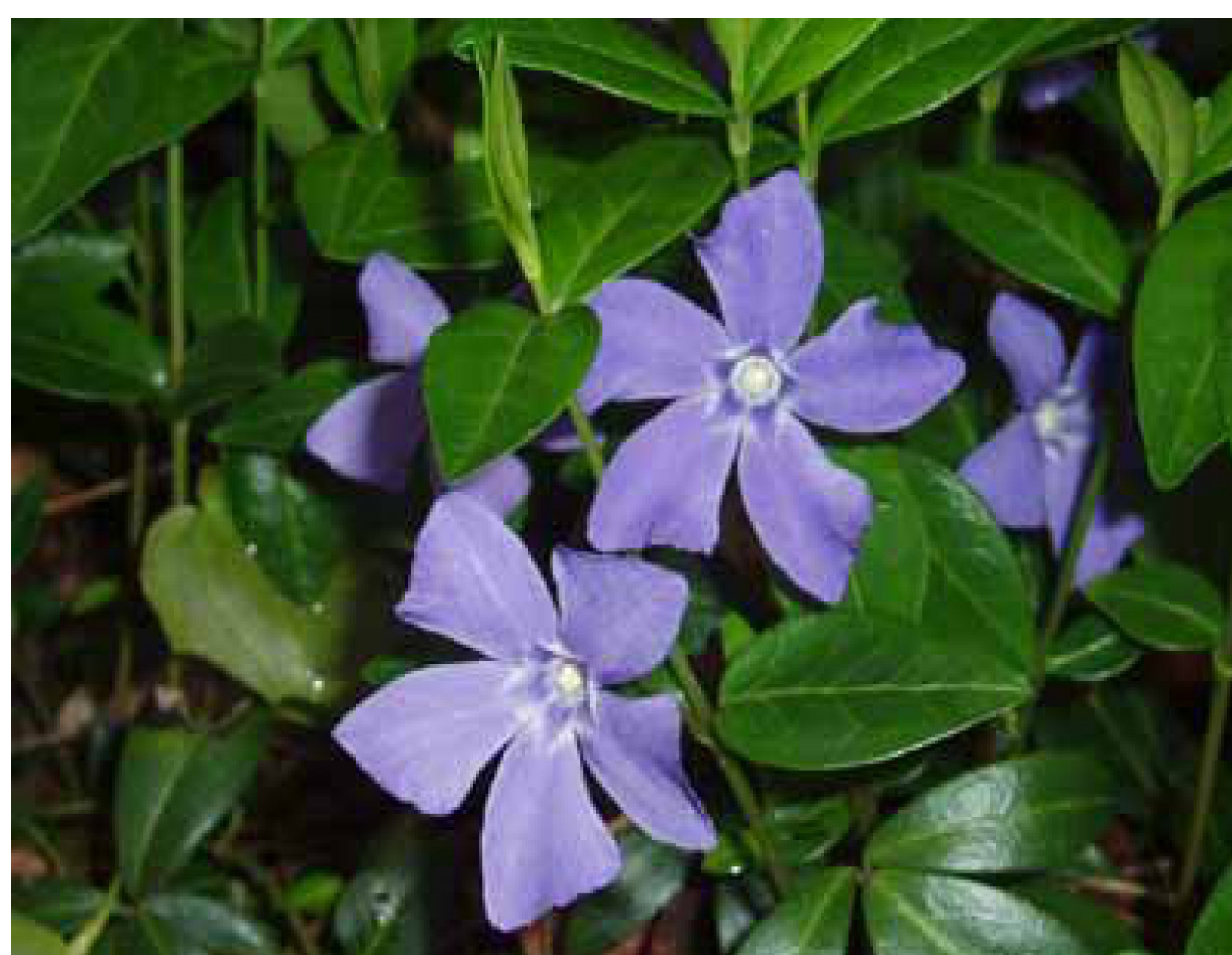
Kleine maagdenpalm ☁️