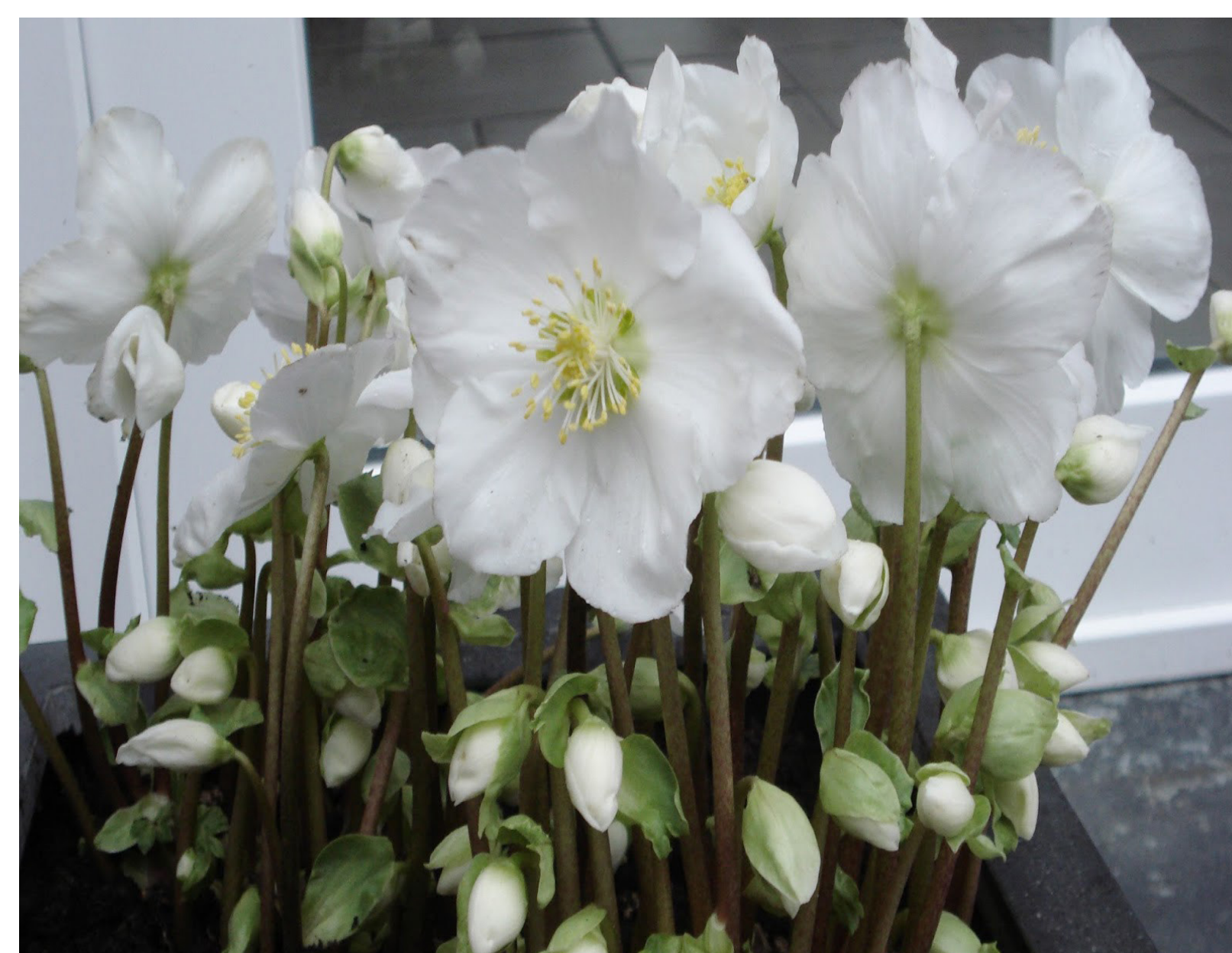
Kerstroos ☁️ 🐝

Neem je liever geen tegels weg, dan is een bloembak de meest eenvoudige manier om je gevel en voortuin op te fleuren