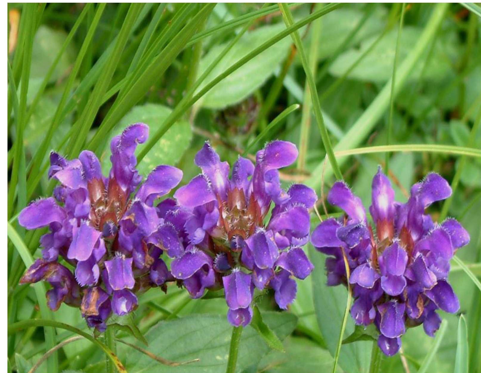
Grote brunel ☀️ 🐝 🦋