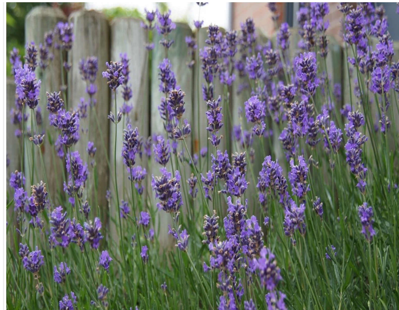
Lavendel ☀️ 🐝 🦋