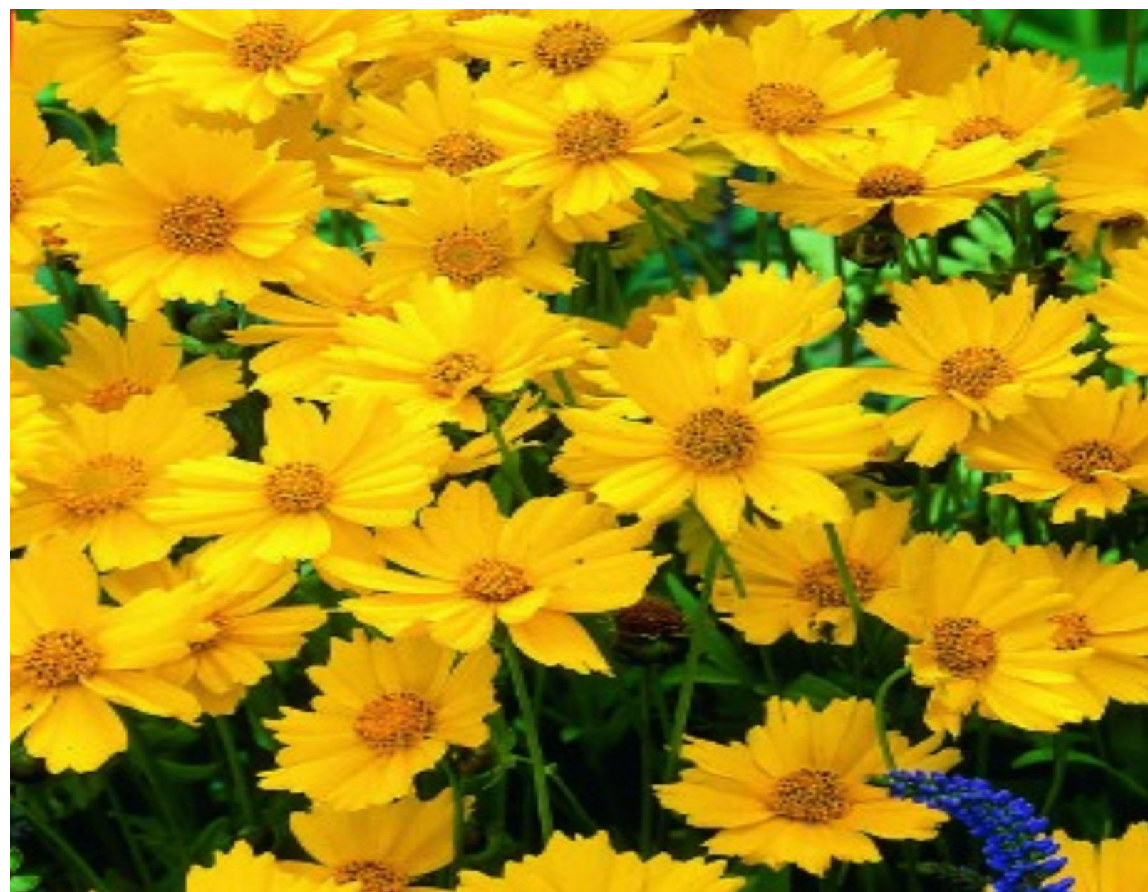
Meisjesogen ☀️ 🐝 🦋