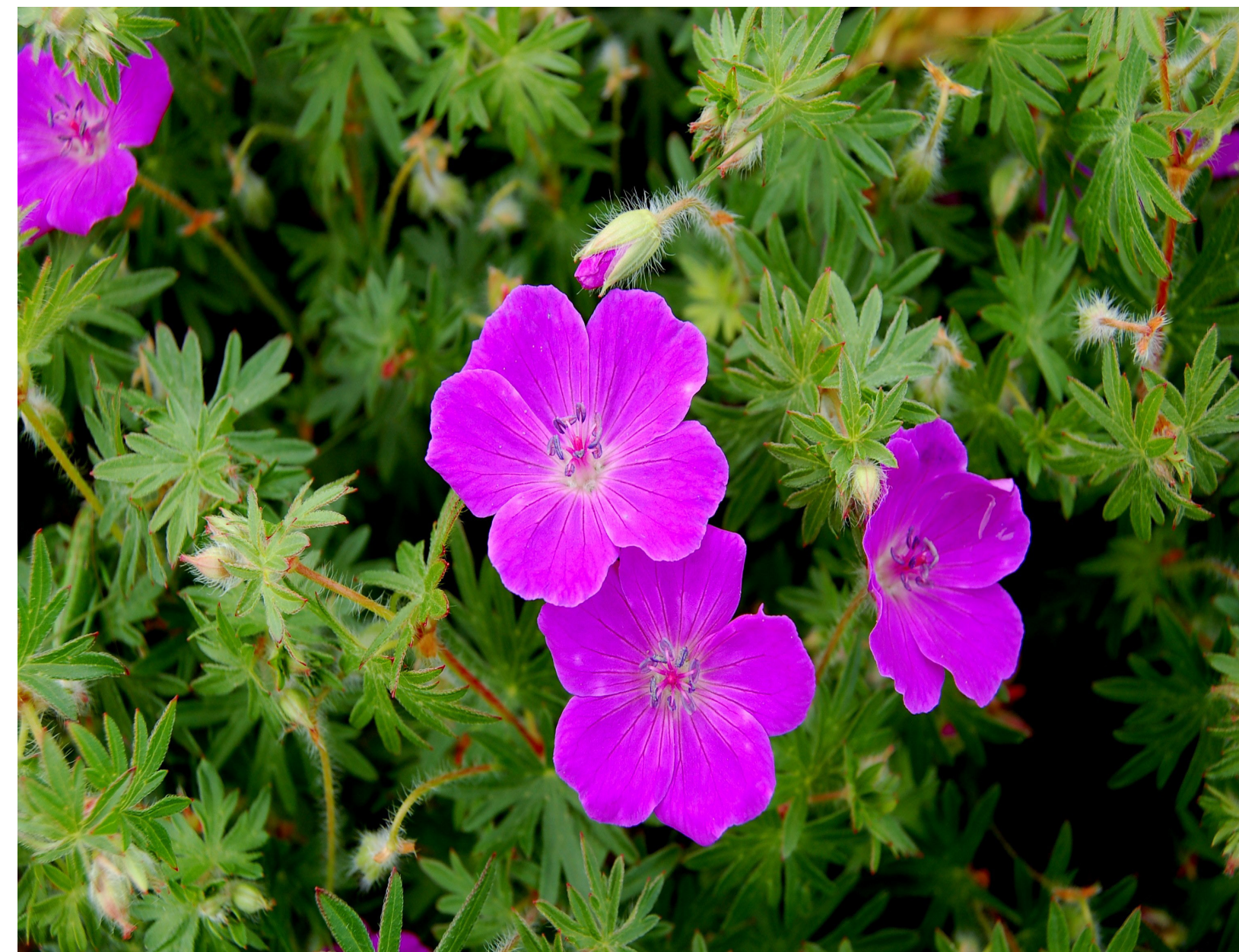
Bloedooievaarsbek ☀️ 🦋