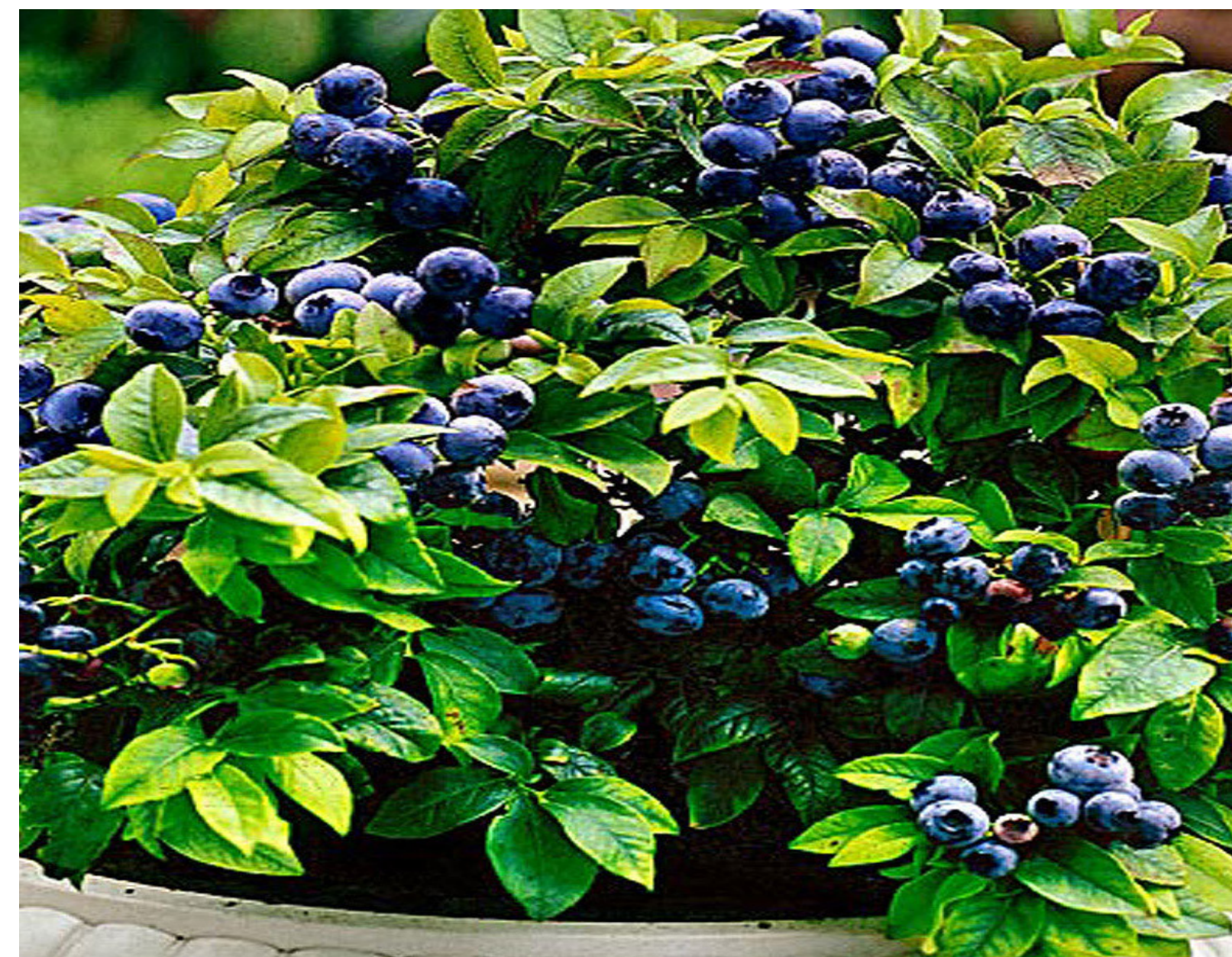
Blauwe bosbes ☁️ 🐝