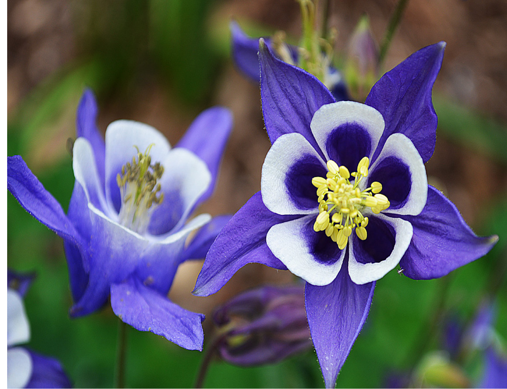
Akelei ☁️ 🦋