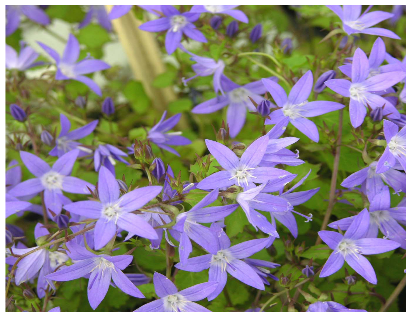
Perzikbladklokje ☀️ 🐝 🦋